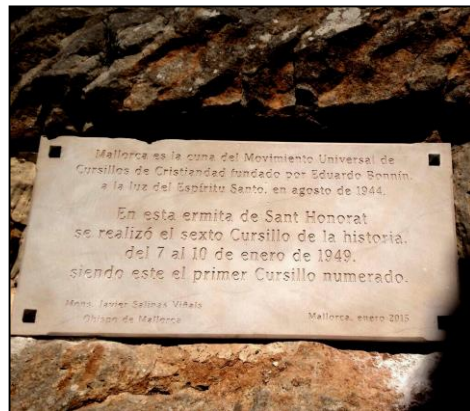
Tấm Plaque Ghi Khóa #1 Cursillo: 7-10/1/1949