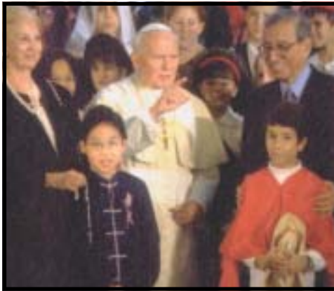
imagen de John Paul II; permitir a la Iglesia la oportunidad de "digerir" el rico magisterio de este magnífico Pontífice; pensar muy detenidamente acerca del desafío Islámico y desarrollar la capacidad de distinguir entre el genuino Islam y el radicalizado, las fuerzas Islámicas politizadas; idear nuevas maneras de relacionar el testimonio moral del papado a la diplomacia de la Santa Sede.

proporcionar esas "llaves": a través del propio magisterio del Papa, y complementado por el trabajo de varios sínodos de obispos. Según Weigel, las tareas claves del siguiente Pontificado será la de continuar la proclamación compulsiva del Evangelio, en la